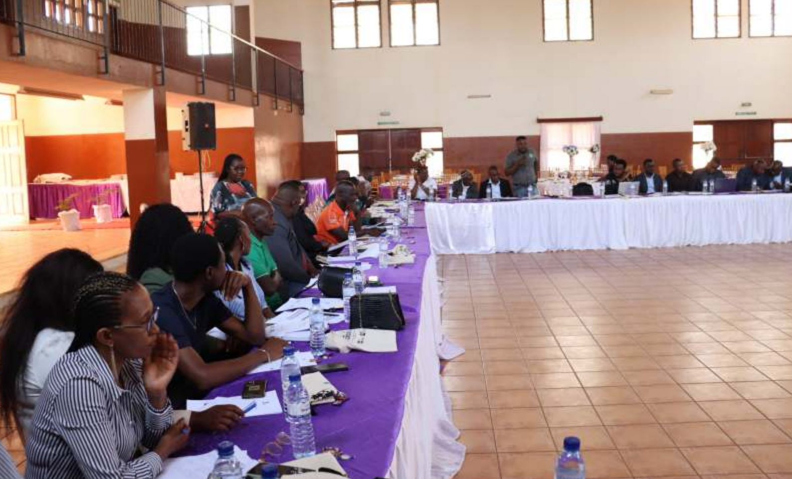
FOTO DO COLABORADOR DA AENA, DURANTE A SUA INTERVENÇÃO NO FÓRUM