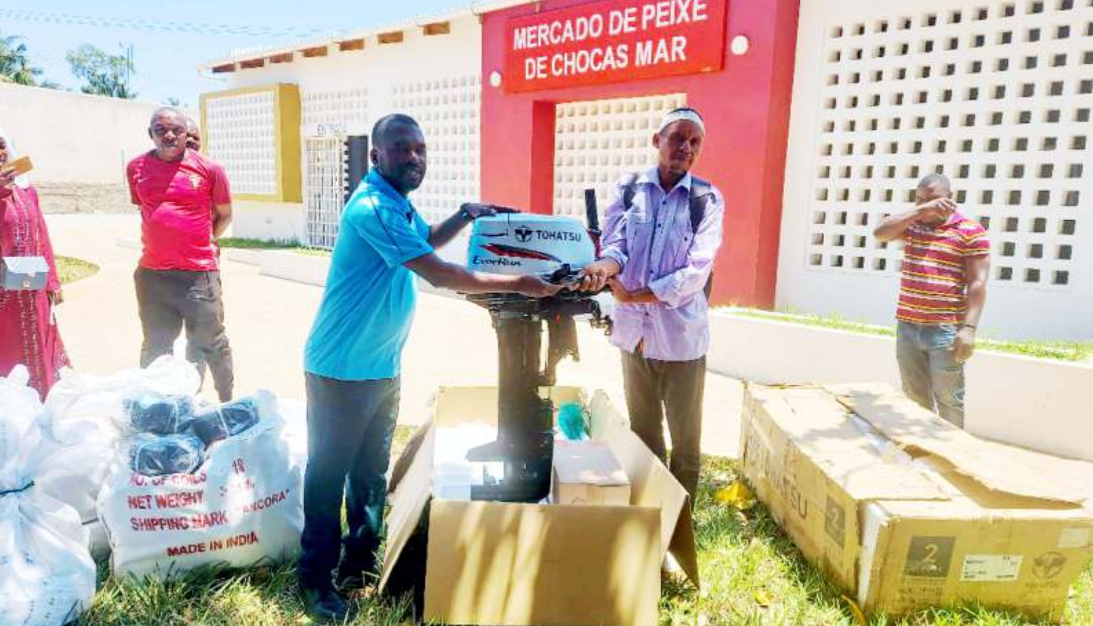
FOTO DA ENTREGA DOS KITS