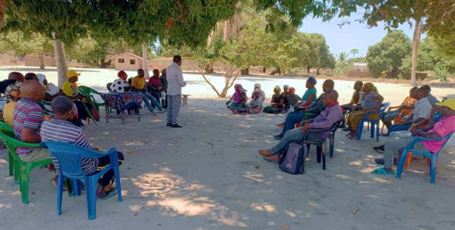
FOTO DO ENCONTRO COM A COMUNIDADE DE CAVA-SEDE